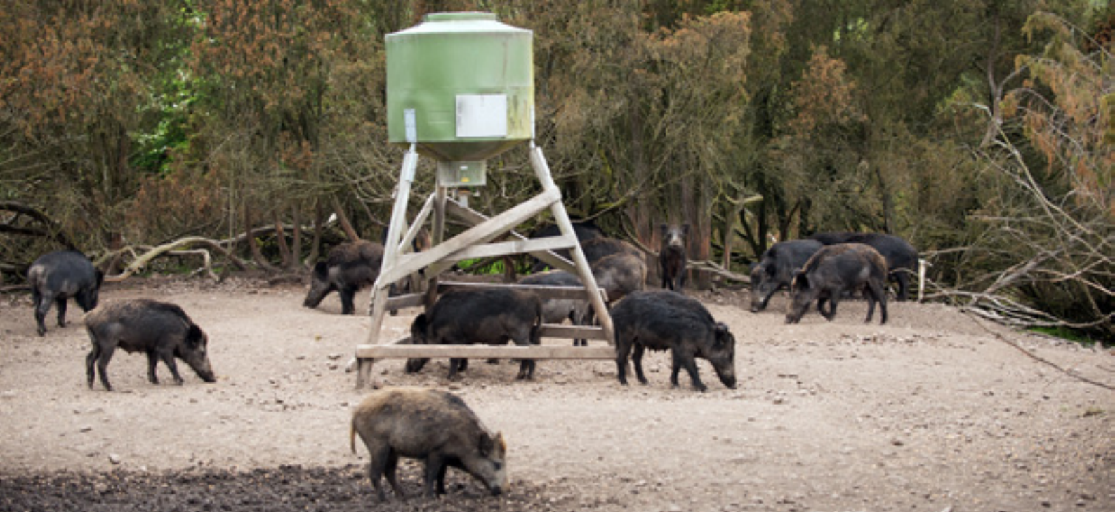
Foderplatsen syftar till att styra vildsvinen från skadekänsliga områden.