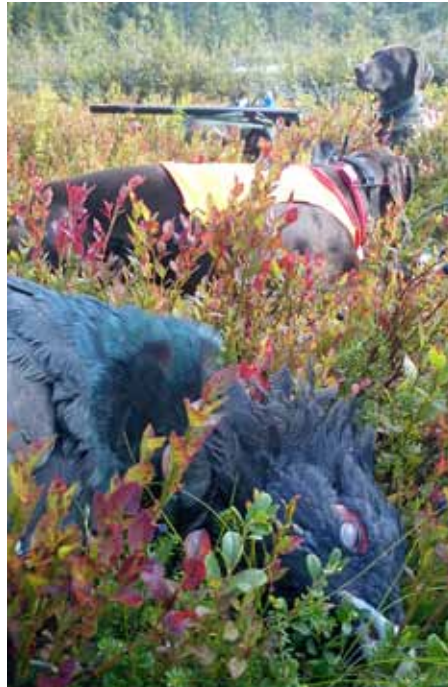
Det är viktigt att rapportera fällt vilt som ger underlag för viltövervakningen. 2013/14 fälldes 2 883 tjädurar i Västerbotten.