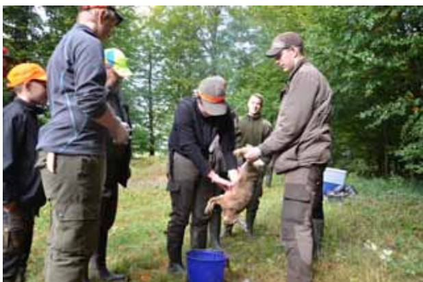
Tillvaratagning av hare vid ungdomsutbildningsjakt i samarbete med Sveaskog.

Många kurser och utbildningar är planerade inom region syd och i länsföreningarnas regi. Kolla på länsföreningarnas hemsidor och på http://jagareforbundet.se/utbildning/