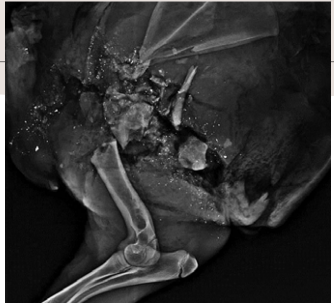
Röntgenbild av genomskjuten vildsvinsbög, där kulan träffat ben och därmed fragmenterat kraftigt.

Är det då farligt? Det är en fråga för den medicinska vetenskapen och ansvariga myndigheter. De anser att allmänheten redan ligger på en